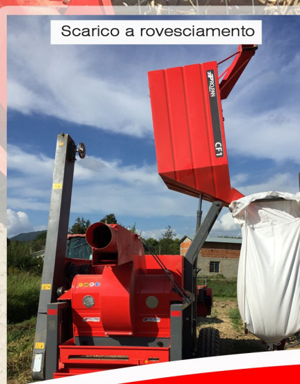
Scarico a rovesciamento