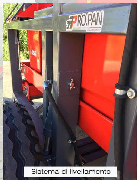
Sistema di livellamento