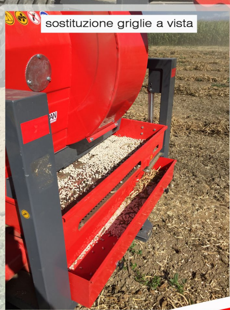
sostituzione griglie a vista